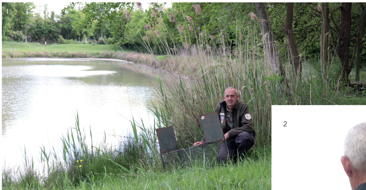
1. Des cages posées à l'étang communal pour piéger les ragondins. 2. Le garde particulier est un agent communal assermenté par le procureur de la République.